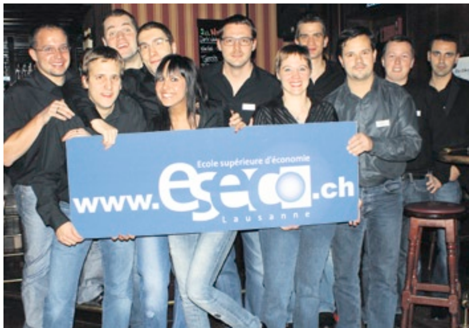
Des étudiants de l'Esecos invitent le public à leur stand au Salon des étudiants les 25 et 26 mars.

Il y a une distinction importante au niveau de leurs conditions d'admission: les ES sont accessibles à tous les professionnels disposant d'un CFC et d'une expérience professionnelle correspondante. Pour les études HES, il est nécessaire d'avoir une maturité fédérale ou professionnelle.