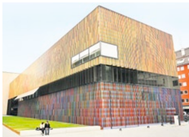
Les rêves de grande carrière des architectes (ici le Musée Brandhorst de Munich) planeront peut-être sur le salon 2010.

OPPORTUNITÉS. Ne manquez pas la 4e édition du Salon des étudiants, qui se tiendra durant deux jours, cette semaine, à Lausanne. L'occasion de s'informer sur les filières et de rencontrer des recruteurs. Première cette année: le forum Ingénierie et architecture HES-SO se déroulera au salon, permettant à 730 étudiants de se profiler auprès de leur futur employeur.